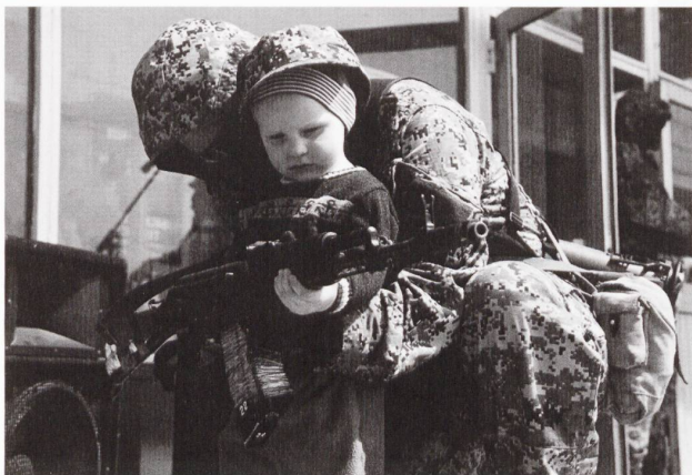
La complexité des conflits modernes et la multiplicité des acteurs demande plus que connaître par cœur...