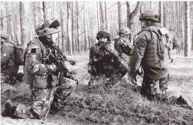
Ci-dessus : Des fantassins de la 5 e brigade hongroise « Bocskai Istvan. »