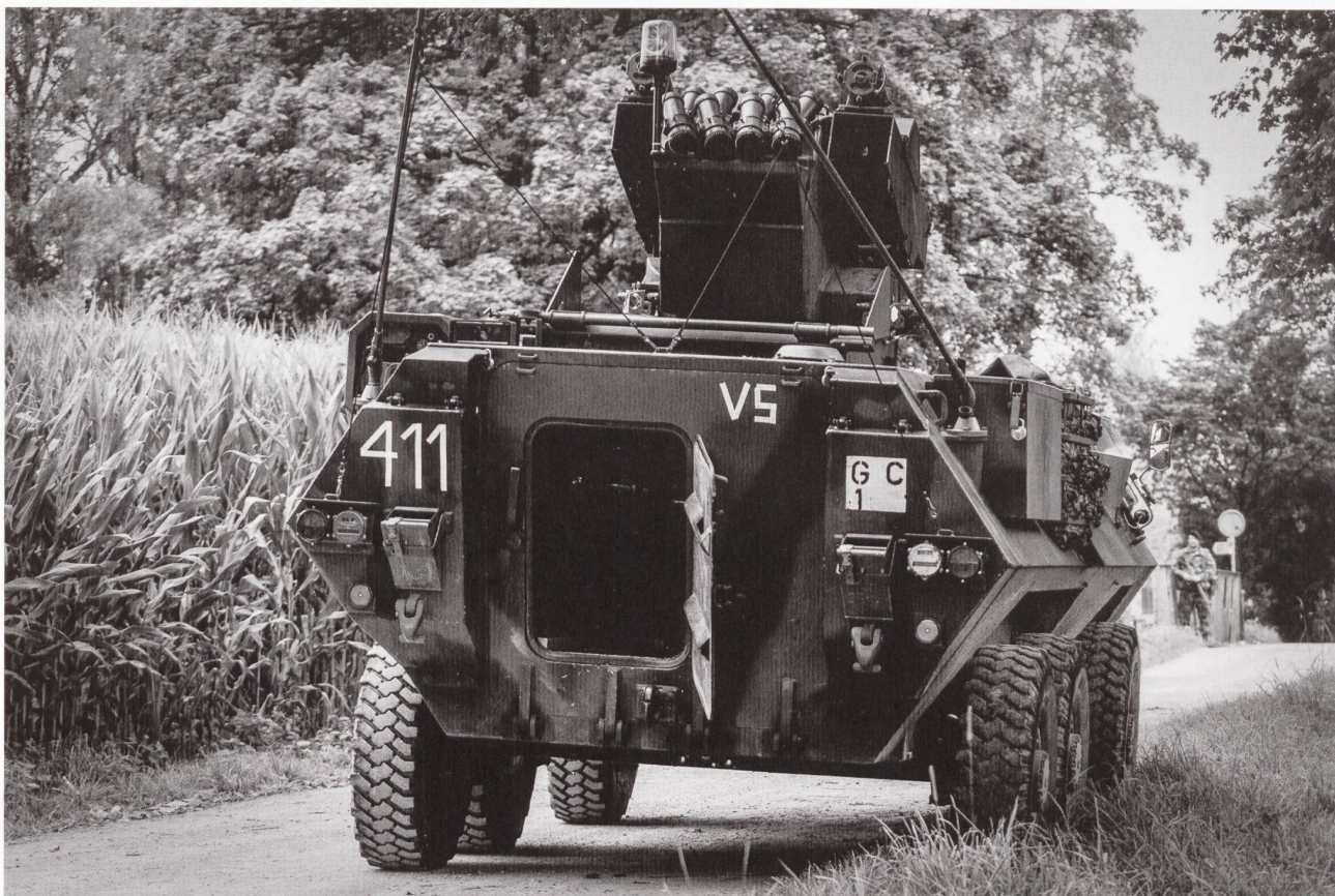
Les chasseurs de chars de la compagnie d'exploration 1/1 durant DUPLEX'14.