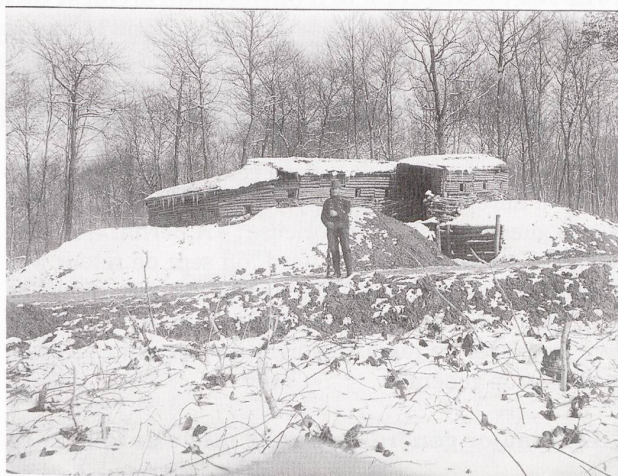
Largin : Le poste d'observation Sud en 1915.

« père ne m'a jamais raconté exactement comment il s'y est pris, mais toujours est-il qu'au moment de manger, les soldats suisses, allemands et français se retrouvèrent réunis, sur le territoire suisse, autour d'une table couverte de mets spécialement préparés et de bougies allumées. Ils étaient une vingtaine ou une trentaine d'hommes qui avaient réussi à faire ce que les politiciens de leurs pays respectifs ne parvinrent à réaliser que quelques années plus tard : la paix autour d'une table. Les hommes des différentes nationalités se jurèrent mutuellement de ne plus tirer les uns sur les autres. (...) Quelques jours plus tard, (...) mon grand-père et ses compagnons apprirent que leurs invités étrangers avaient été mutés sur d'autres fronts où ils étaient de nouveau obligés de tirer sur des ennemis inconnus 3 . »