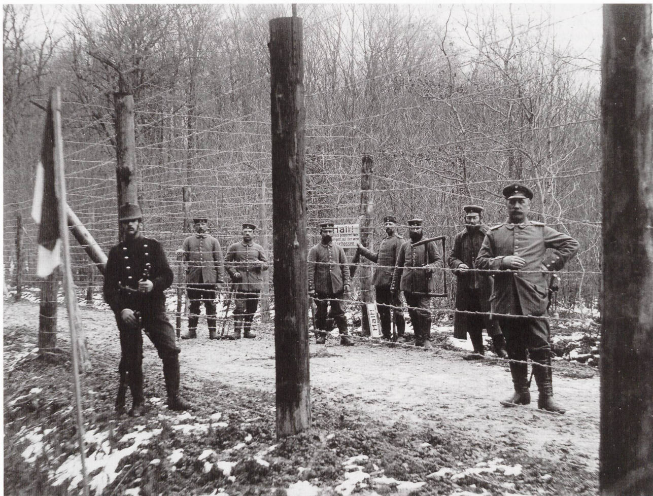
La barrière allemande à la frontière du Largin.

En arrivant dans la position, on ressent une émotion, une sorte de malaise. On est là, debout, comme protégé par le drapeau rouge à croix blanche, observé par des centaines d'yeux invisibles. On veille, on guette l'indice qui annoncerait une attaque contre le pays, ce qui n'empêche pas d'avoir des contacts avec les voisins français et allemands, de faire avec eux de menus échanges. On doit parfois éprouver un sentiment d'impuissance, quand les artileries belligérantes se déchaînent. Tous les citoyens-soldats souhaitent passer dans cet avant-poste, cette première ligne où ils se trouveront au contact des soldats des deux camps, qui se battent, souffrent et subissent les