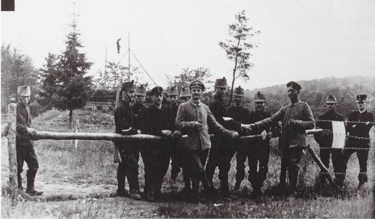
Au Largin, des soldats suisses posent avec des gradés allemands. Tout à droite un garde-frontière suisse.