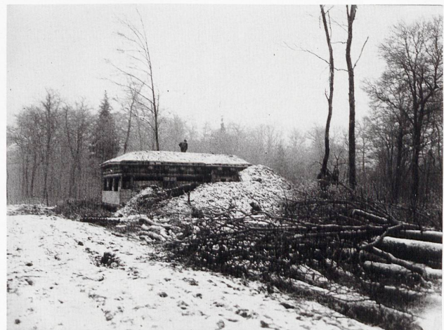
Largin: Le poste d'observation Nord, construit en 1915.

La Suisse, devenue un lieu de transit utile pour les deux camps, travaille au profit des belligérants. Leurs commandes stimulent l'exportation de produits utiles à l'effort de guerre, comme les composantes horlogères, les produits manufacturés, les denrées