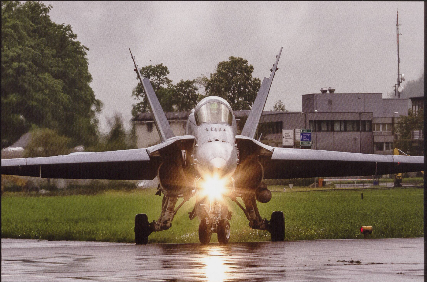
Hornets sous la pluie. Merci à Antony Shaf pour ces photos d'un exercice sur l'aérodrome de Buochs (NW). Photos © Neo-Falcon Photography.