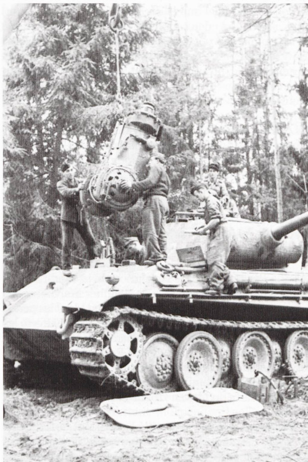
Ci-dessous : changement de la boîte de vitesse d'un PzKpfw V Panther Ausf. A en Russie, été 1944.