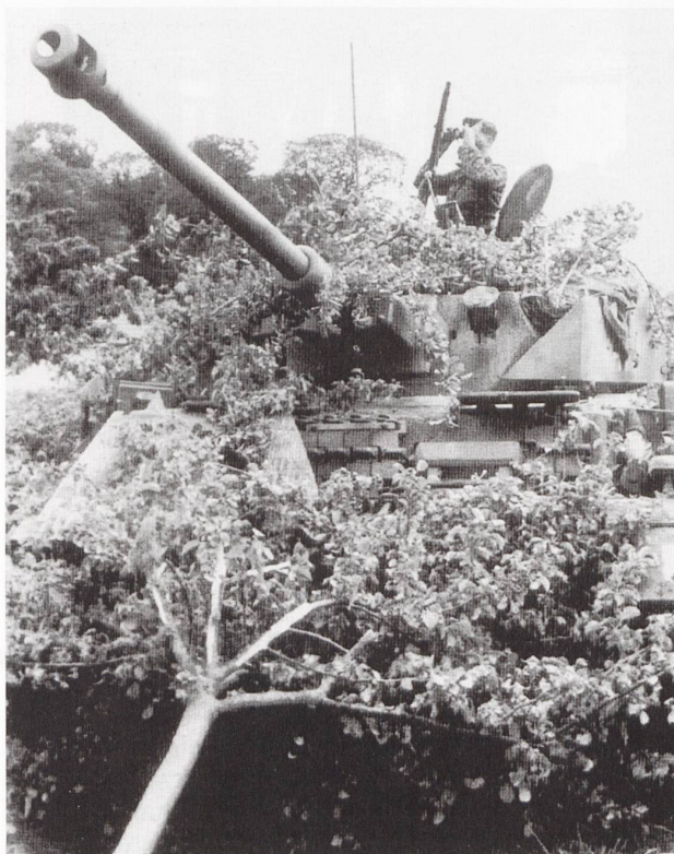
Ci-dessus : un PzKpfw IV Ausf. G du II./SS-Pz.Rgt. 12 près de Caen, durant l'été 1944.