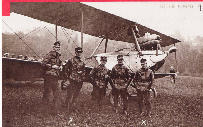
Le Beudenberg, au Nord de Berne, a été choisi comme base aérienne en raison de ses infrastructures.