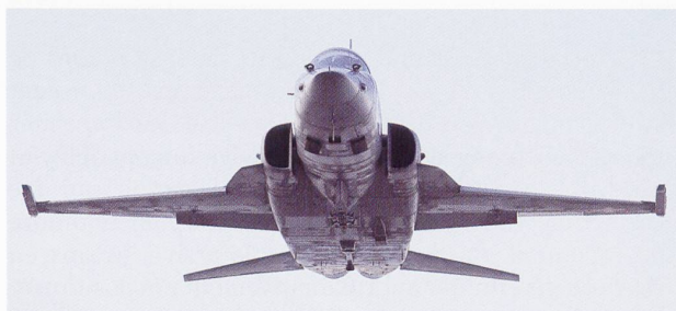
Le Programme d'armement 2015 prévoit le retrait des F-5E/F Tiger , entrés en service dans les Forces aériennes à partir de 1979. 42 monoplaces et 12 biplaces sont encore en service, répartis en trois escadrilles (6, 8, 19).