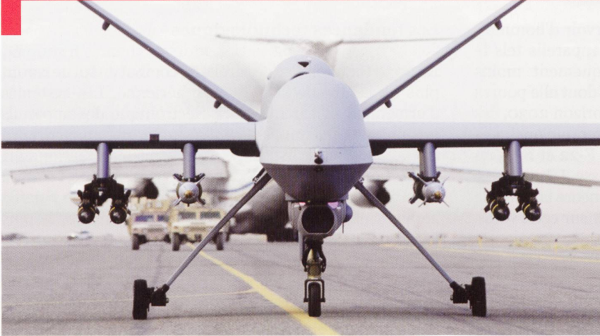
Plus de 40 drones de combat Reaper sont actuellement opérationnels, sur les 480 commandés.