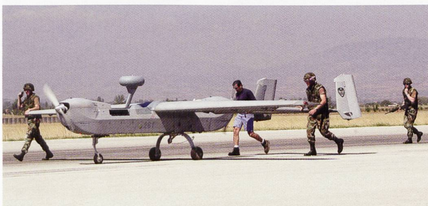
Le Hunter sert avant tout à l'exploration tactique