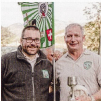
Les tireurs vaudois, en compagnie du Chef de l'Armée, le cdt C André Blattmann.