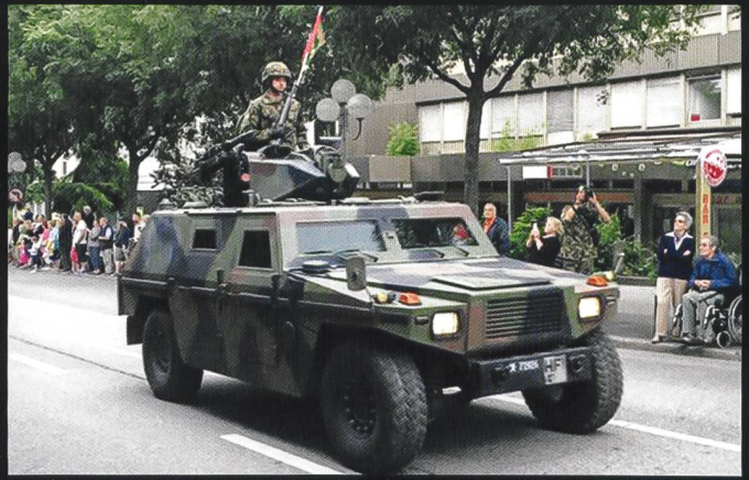
De haut en bas : véhicule d'exploration 93/97 Eagle; char de grenadiers à roues 93 Piranha; et GMTF. En bas : Pas de mobilité ni de capacité à durer sans logistique.