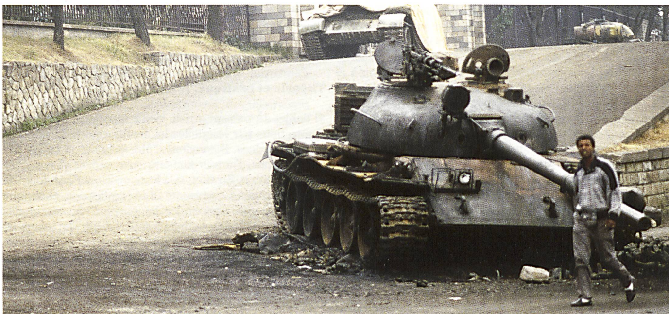
La chute du régime du Derg, T-62 et T-55 détruits ou abandonnés devant les grilles du palais présidentiel d'Addis-Abeba en 1991.