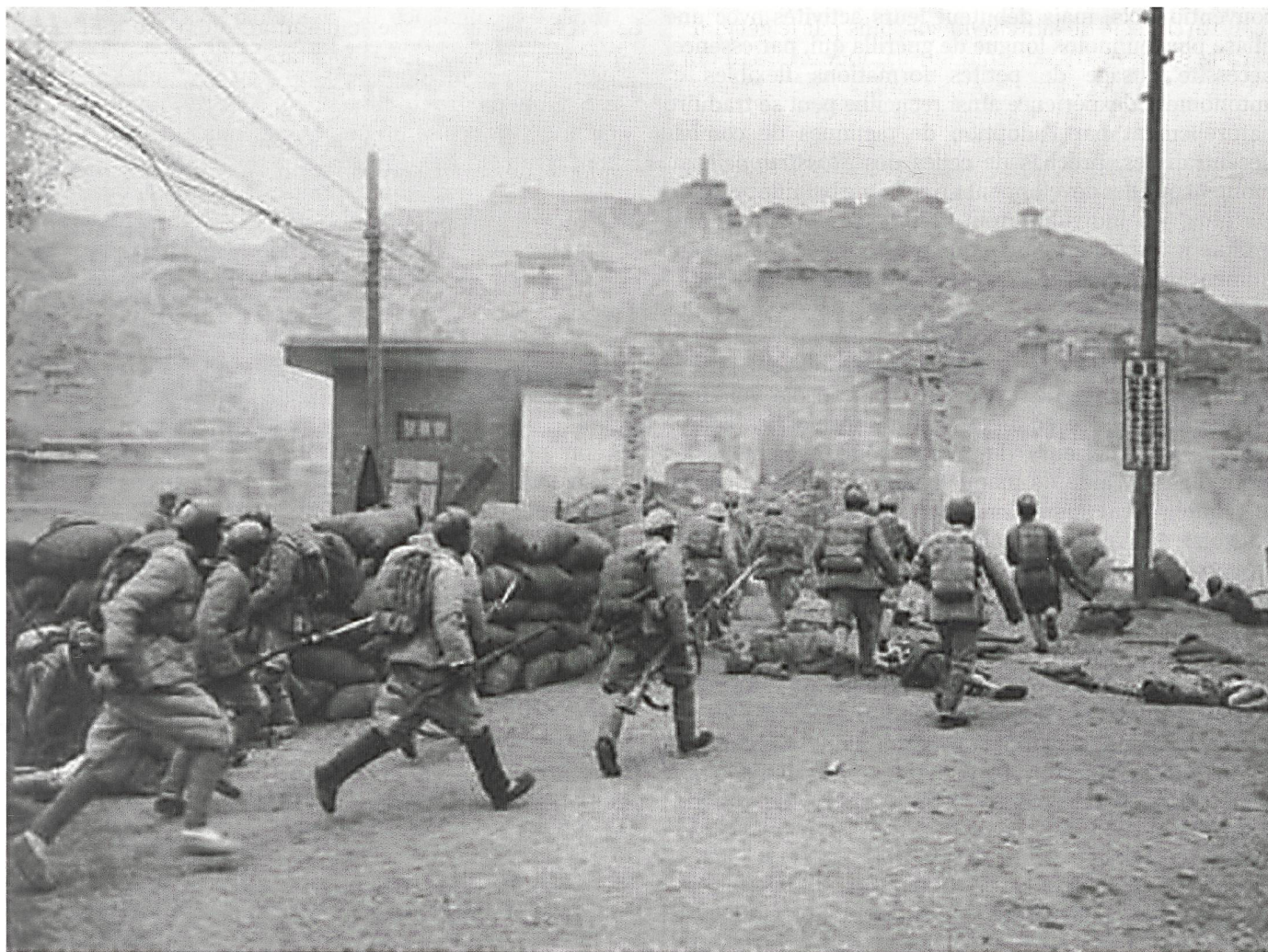
Août 1949, les forces communistes sont sur le point de mettre fin à la guerre civile chinoise après trois années durant lesquelles elles se montrèrent bien supérieures à une armée nationaliste pourtant mieux équipée.

alors contre elle. La 15 e armée japonaise s'immola ainsi littéralement contre les bastions britanniques à Imphal et Kohīma en 1944.