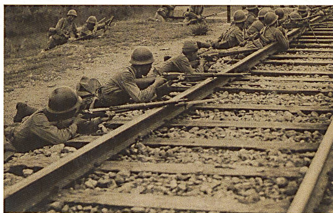
Soldats de l'armée impériale japonaise immortalisés par un photographe du magazine Asahigraph en septembre 1937, près de Pékin.

L'Armée Populaire de Libération chinoise (APL) surprit la planète entière durant les derniers mois de l'année 1950 lorsque deux de ses groupes d'armée, chapeautant neuf armées de campagne totalisant environ 300'000 hommes, franchirent le fleuve Yalu et boutèrent les forces de l'ONU hors du territoire nord-coréen. Cette force massive, mais pratiquement dépourvue d'artillerie et ne disposant pas de tanks ni de moyens mécanisés, appuyée par une chaîne logistique rudimentaire et dont les communications entre unités dépendaient en grande partie d'estafettes - voire au combat, de sifflets, trompettes et gongs - prit l'ennemi par surprise. Manœuvrant en terrain montagneux et dans un climat glacial, les Chinois forcèrent à plusieurs reprises de grandes formations motorisées ennemies à retraiter en catastrophe pour éviter l'anéantissement après être tombé sur leurs arrières. Les tactiques utilisées auraient pourtant été familières pour des vétérans des campagnes de Malaisie et de Birmanie en 1942. Les soldats communistes cherchaient eux aussi l'imbrication, attaquaient le plus souvent la nuit et s'infiltraient dans le dispositif ennemi, exploitant immédiatement la moindre brèche pour y pénétrer en force tout en contournant les points de résistance pour déboucher aussi rapidement