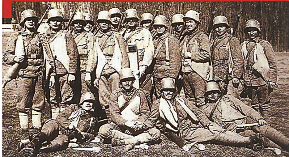
Un groupe de combat des Stosstruppen allemands photographié en 1917