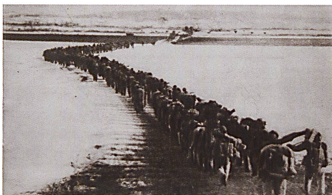
Une colonne de l'APL entrant en Corée du Nord

que possible sur les arrières de l'adversaire et y établir des barrages.