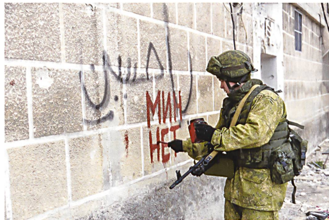
Ci-dessus : Un sapeur russe peint « pas de mines » sur le mur d'une maison à Alep et ci-dessous : Opérations de déminage par en trinome de sapeurs et avec un chien détecteur de mines.