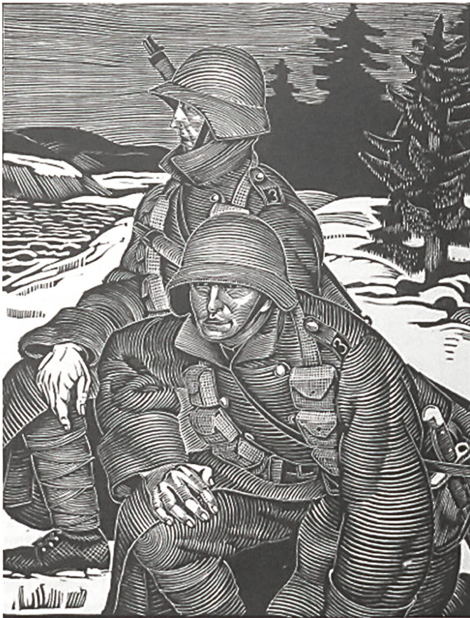
Un bois d'Henry Meylan.

d'une revue d'art, un membre de la Ligue vaudoise. Dans les années 1930, il conduit de nombreuses campagnes politiques. Doué pour l'écriture, il se profile très tôt dans le journalisme comme billettiste, chroniqueur politique et militaire. On le lit beaucoup dans la Tribune de Lausanne et la Gazette de Lausanne . Le commandement du régiment d'infanterie 2, la présidence de la Société suisse des officiers l'amènent à s'abstenir de toute prise de position politique à partir de l'été 1939.