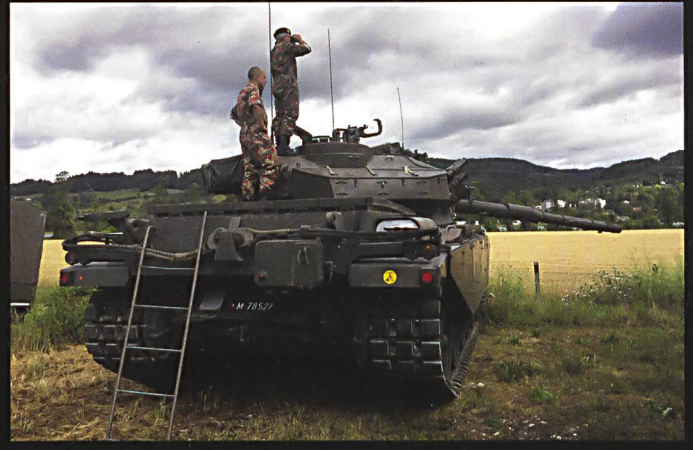
Une silhouette familière : le char 55 Centurion équipé du simulateur de tir « solartron. »