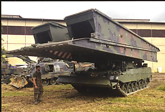
Le nouveau char poseur de ponts a été présenté au public. Ci-dessous : La silhouette bien connue du char 68, ici à tourelle étroite, contraste avec celle du T-72.