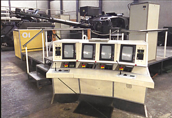
Le simulateur de tourelle de Centurion a été adapté à son nouvel emploi, à partir des années 1990, en tant que bunker antichar.