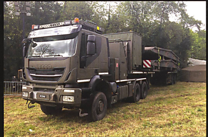
Comme dans le cas du char pont 68, des éléments de ponts supplémentaires peuvent être acheminés par camion. Ci-dessous : A Full, de nombreux prototypes de la société Mowag sont exposés en sous-sol.