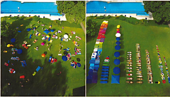
« De l'ordre dans l'art » par l'artiste suisse Ursus Wehrli, une illustration des conséquences d'une pensée logique et réductionniste sur un système complexe.

et agrège la connaissance de chaque pièce vers la connaissance de l'ensemble ;