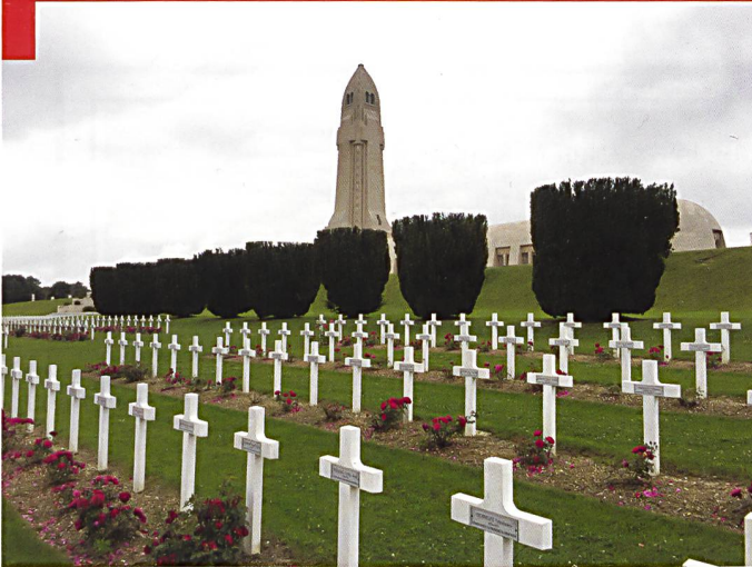
Une vue impressionnante de l'ossuaire de Douaumont, entouré de cimetières.