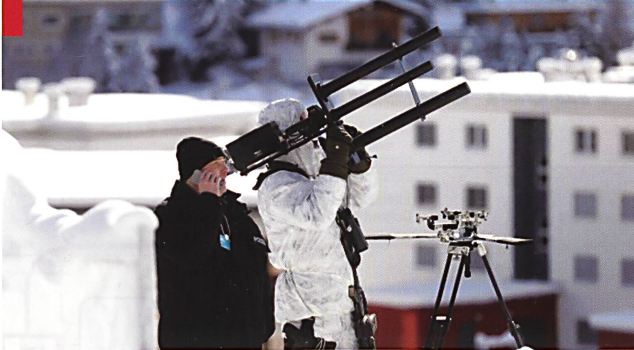
Un brouilleur anti-drones engagé par la police bernoise au World Economic Forum (WEF) à Davos.