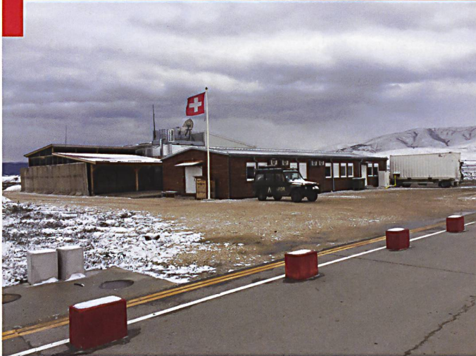
Camp des Forces aériennes sur la base KFOR à Slatina (Kosovo).