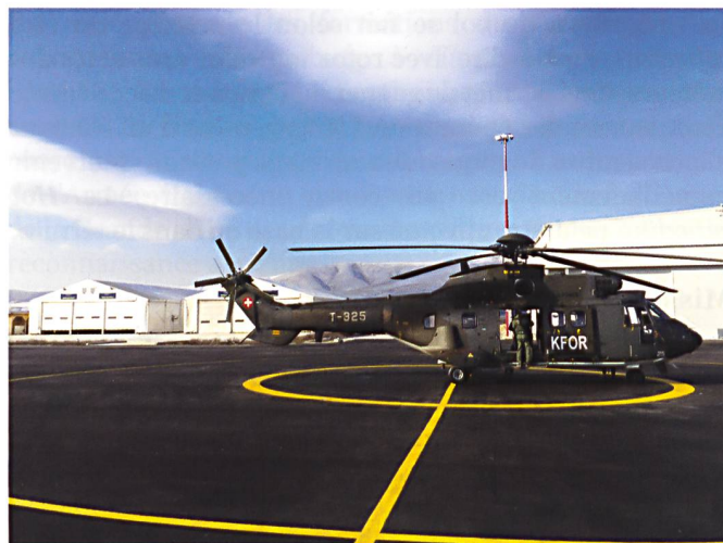
Tentes des Forces aériennes (à gauche) sur la base KFOR à Slatina (Kosovo).