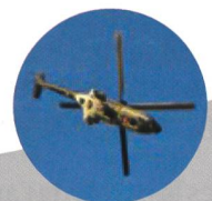
Super Puma Solo Display

RUAG Training Support, partenaire des Forces Terrestres