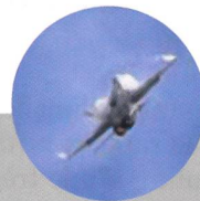
F/A-18 Hornet Solo Display