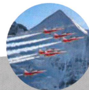
Patrouille Suisse (sous réserve)