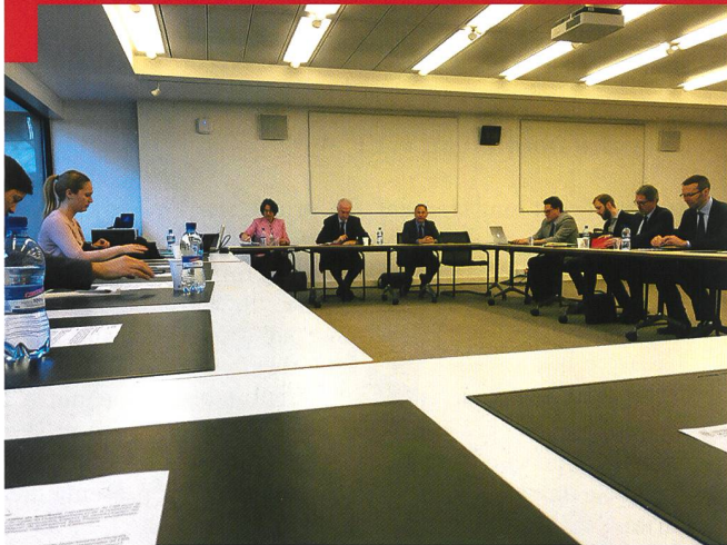
Gilles de Kerchove à l'Université de Genève.