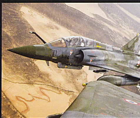
A gauche, de haut en bas: Mirage 2000-5, 2000N et 2000D.