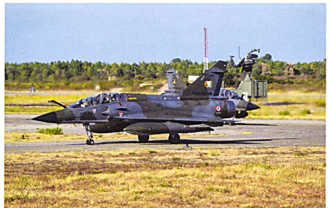
Ci-dessous : Deux appareils du 2/4 Lafayette au roulage.