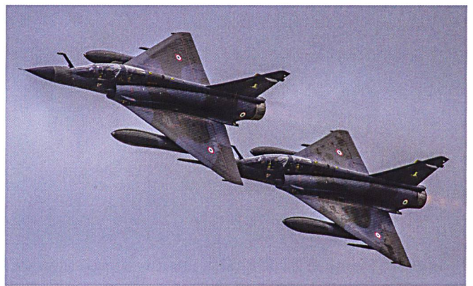
Ci-dessus : Deux appareils de l'EC 2/4 en vol au-dessus de Payerne.

En 2014, plusieurs Mirage 2000D opérant à partir des Emirats arabes unis (EAU) et de Jordanie ont été engagés dans l'opération CHAMMAL, contre les forces de l'Etat islamique en Irak puis en Syrie. Une frappe particulière, le 21 août 2016, a vu quatre Rafale et quatre 2000D lancer une douzaine de missiles SCALP-EG (opération HAMILTON).