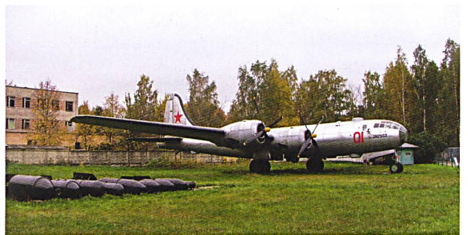
Ci-dessus : Un Tu-4 Bull , version soviétique du B-29 américain, exposé au musée de Monino.