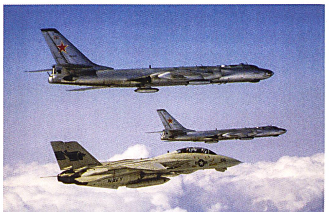
Ci-dessous : Deux Tu-16 Badger escortés en 1984 par un F-14A Tomcat de la Marine américaine.