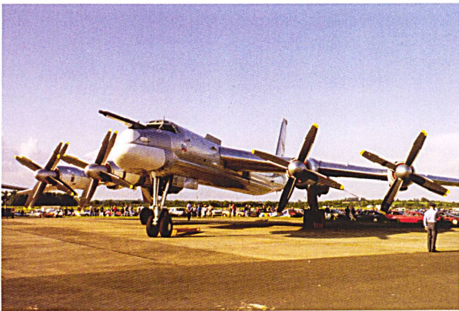
Le Tu-95 Bear F avec ses quatre moteurs et ses doubles hélices contrarotatives.