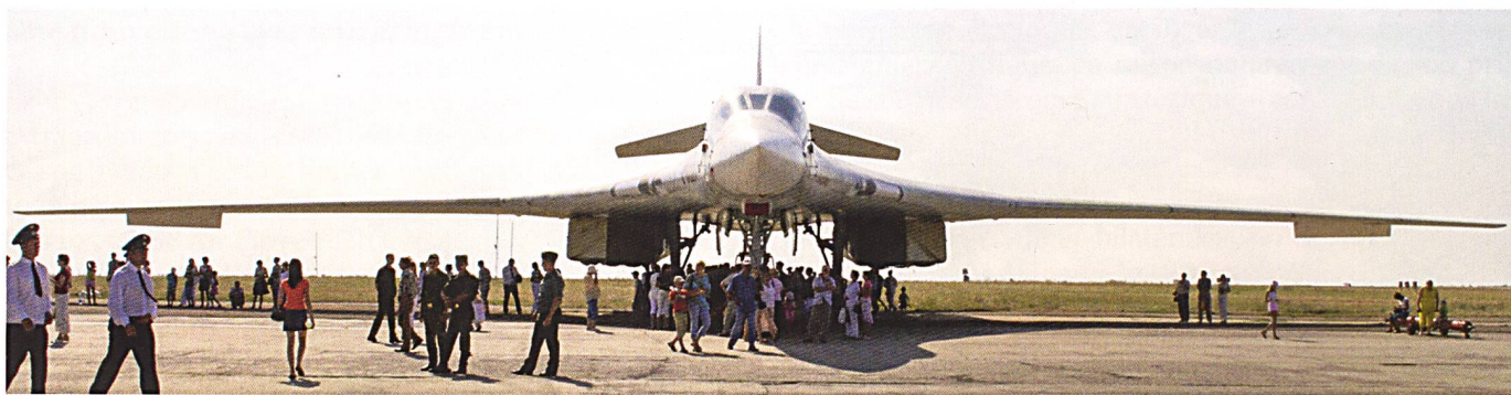
Le Tu-160 est aujourd'hui le plus grand et le plus lourd bombardier au monde. Ses dimensions impressionnantes sont visibles lors de cette journée portes ouvertes des VVS.