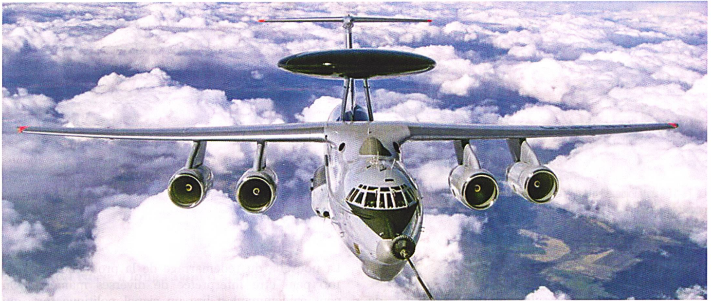
Ci-dessus et à droite: Ravitaillement en vol d'un avion d'alerte avancée et de commandement Beriev A-50. La cellule de cet appareil, comme celui de son ravitailleur, est basée sur l'avion de transport Ilyushin Il-76 Mainstay .

depuis 1983. Elle reçoit un nouveau système d'armes, une nouvelle tourelle défensive à l'arrière qui ne compte plus qu'un seul canon, enfin un lanceur rotatif dans la soute à bombes – similaire à son rival le B-1B. La version M3 est ainsi optimisée pour le vol à basse altitude; elle est plus rapide mais surtout, son rayon d'action est augmenté de près d'un tiers. Au total, 268 appareils sont produits entre 1977 et 1993.