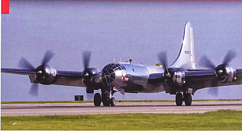
Le bombardier stratégique américain B-29 a contraint les stratèges soviétiques à investir dans les armes stratégiques.