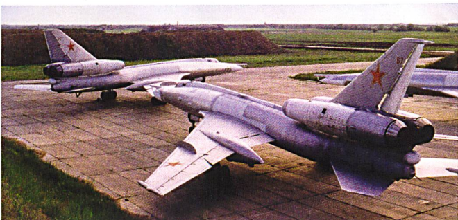
Décollage à Engels de plusieurs Tu-22 Blinder . Un appareil difficile à piloter.

1'000 kg et la charge nucléaire représente 350 kilotonnes. Mais le Tu-16 ne fait pas le poids face aux bombardiers stratégiques américains développés durant les années 1950. Le B-52 Stratofortress est beaucoup plus lourd (83,3 tonnes à vide) et capable de frapper beaucoup plus loin (7'210 km à une vitesse de croisière de 844 km/h). Quant au B-58 Hustler , il ne pèse que 25,2 tonnes à vide mais est capable d'atteindre Mach 2 et peut atteindre 3'220 km de rayon avec une charge offensive de 8'820 kg. La course à l'armement stratégique est lancée.