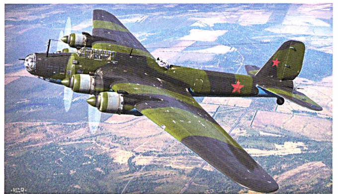
Le quadrimoteur Pe-8 est un engin moderne mais aux performances insuffisantes.