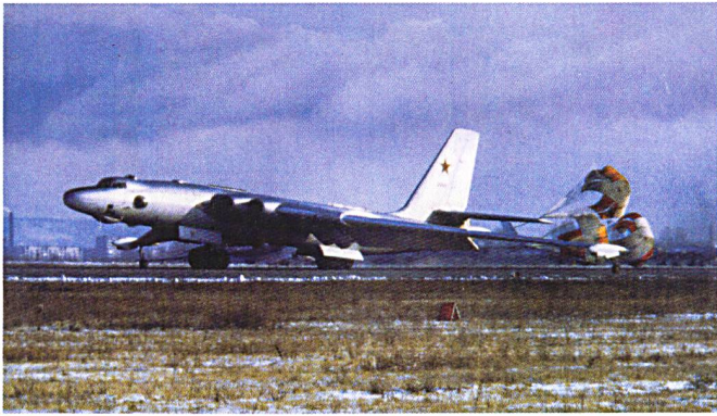
Atterrissage d'un Myasishchev Mya M-3M Bison .