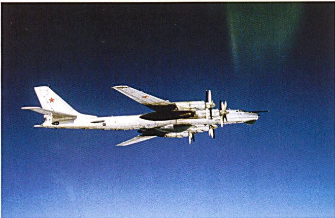
Le Tupolev 142, reconnaissable notamment à son nez vitré, porte un puissant radar sous le ventre. Il s'agit de la version de surveillance et d'attaque navale du Bear . Il n'est pas considéré comme un bombardier stratégique au sens des traités internationaux.