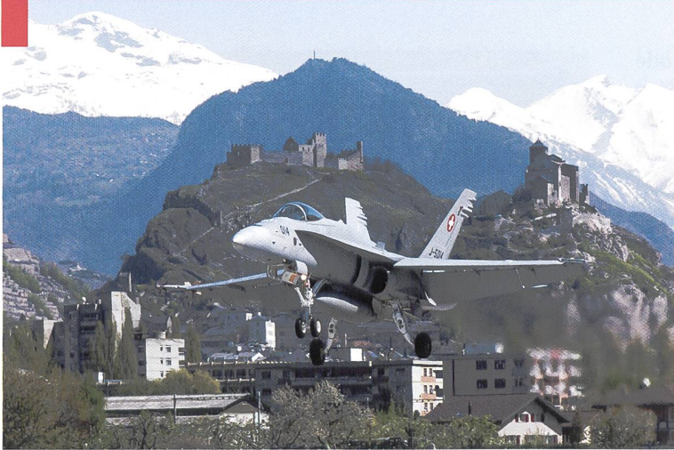
F/A-18 à l'atterrissage à Sion.