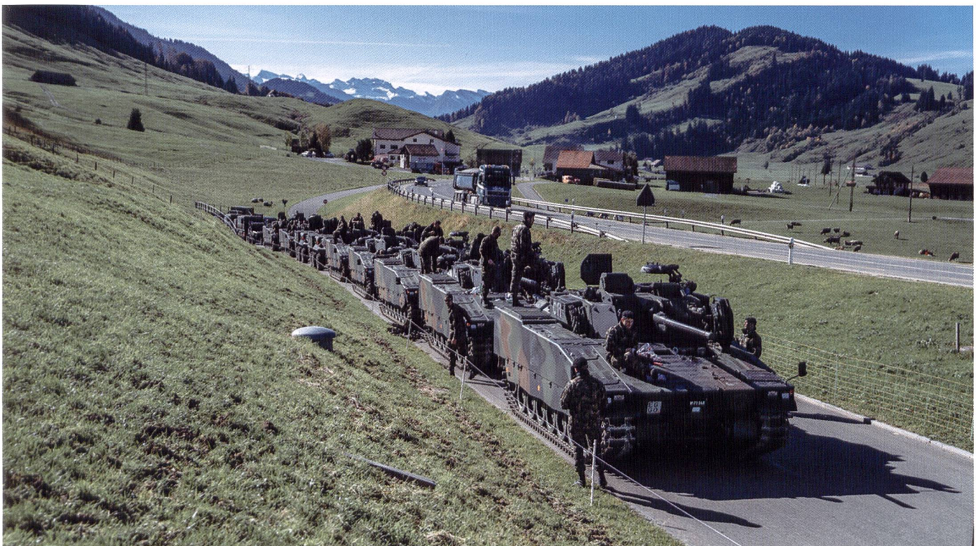
Ci-dessous : Halte de marche d'une compagnie de grenadiers de chars durant l'exercice GLADIUS.