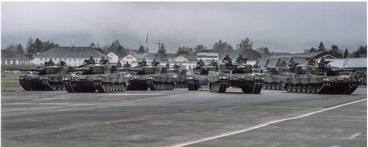
Ci-dessus : Défilé mécanisé organisé à l'issue de l'exercice de troupes GLADIUS.