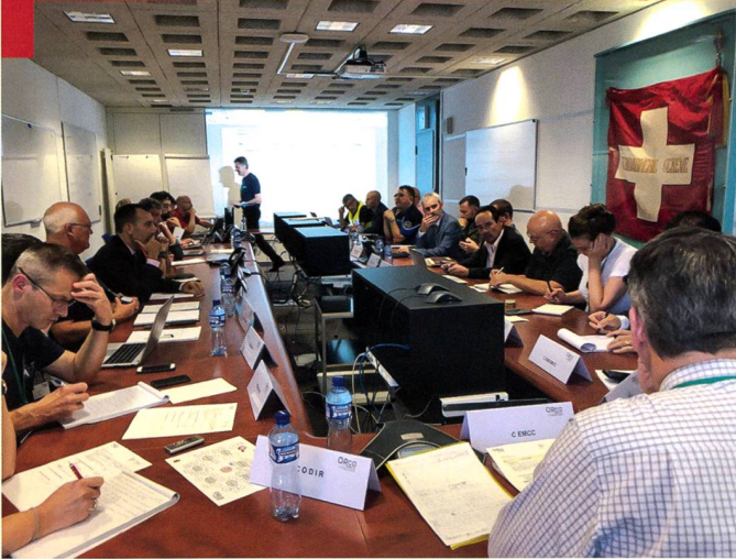
Rapport de situation de l'état-major cantonal de conduite (EMCC) genevois lors de l'exercice CONFINE TRE.