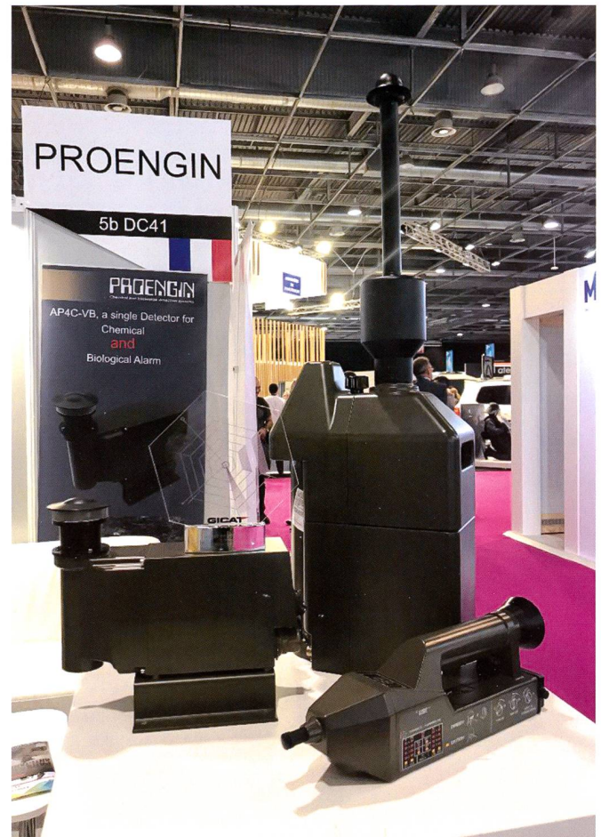
Systèmes de détection chimique et biologique fabriquées et développées par l'entreprises Proengin.

Les interrogations à avoir au sujet des NRBC demeurent, en particulier sur les moyens et les solutions qui peuvent être apportés. Les entreprises qui existent en la matière sont abondantes et très diversifiées. Lors du dernier salon