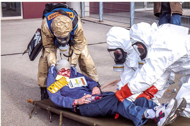
Recueil de blessés durant NRBC19.

Au cours de cette conférence, une notion émerge : la résilience. Le patron d'Ouvry en donne les clés : « La résilience cela veut dire la capacité d'une société, d'un ou des Etats à avoir une réponse qui soit à la bonne hauteur. Surtout qu'elle ne soit pas bloquée à un épisode malheureux. Je m'explique : admettons que l'on ait une superbe technologie qui répond à Ebola, sauf que celle-ci vient d'un seul pays. Exemple : il y a un seul fournisseur au monde qui est aux Etats-Unis. Et puis pour une raison lambda ils n'ont pas envie de donner la technologie. Les Etats en question effectivement n'ont pas la résilience ni la capacité à rebondir parce qu'il n'y a aucune solution. La résilience en général dans un Etat, c'est de donner la capacité d'avoir plusieurs sources potentiels d'approvisionnements et d'être capable de répondre dans tous les cas (...) ». Et de finir : « Créer un système européen pour éviter d'avoir ce phénomène de rupture ». La multiplication des menaces NRBC est encore aujourd'hui présente de manière protéiforme. Elles demandent une vigilance de tous les instants.