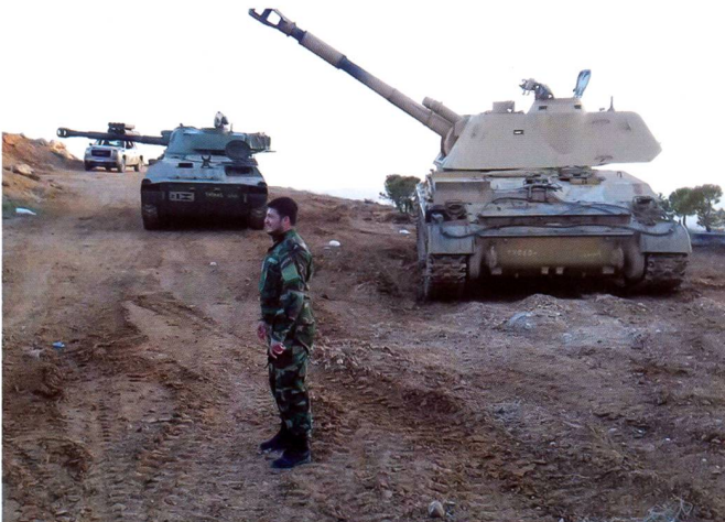
Un obusier 2S1 (à gauche) et 2S3 (à droite) assurent l'appui de feu direct et indirect à l'entrée d'une localité syrienne.

égyptien issu des frères musulmans, Mohamed Morsi début juillet 2013.» L'occasion pour l'Etat islamique de démontrer aux égyptiens que les djihadistes ont leur Etat en Syrie et en Irak. C'est un appel pour les candidats au djihad en territoire du califat Syrie et Irak où il va y avoir un pic des arrivées.