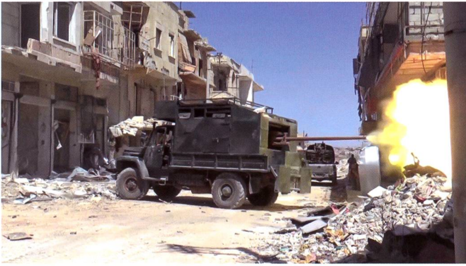
Un camion russe a reçu des plaques de blindage et emporte, sur son pont arrière, un canon de DCA de 57 mm. Ce type d'armes improvisées ou modifiées est visible en grand nombre en Syrie.

Hezbollah libanais, des milices irakiennes et afghanes par la suite. Tout cela apporte de l'eau au moulin des djihadistes qui disent depuis le début que ce n'est pas un conflit politique mais religieux entre sunnites et chiïtes. Le débarquement des milices chiïtes dans le conflit va valider cette grille de lecture du conflit. Je me souviens d'un épisode: la conférence du Caire de juin 2013, quelques semaines avant le coup d'Etat du général Sissi en Egypte. Elle fut organisée en réaction à la chute d'une petite ville stratégique en Syrie qui était tenue par les rebelles. C'est une bataille qui a lieu en mai 2013 qui marque l'entrée officielle du Hezbollah libanais dans le conflit syrien. Une action qui va provoquer une vague d'indignations gigantesques dans la région et dénoncer la présence du hezbollah lors de cette conférence. A celle-ci participe beaucoup de religieux de différents courants, mais qui vont dans ce contexte de radicalisation, tenir un discours très proches des djihadistes. Et, y compris en affirmant que c'est un devoir de tous les musulmans d'aller se battre en Syrie, alors que jusqu'à présent, il proposait d'envoyer de l'argent, mais pas d'aller se faire tuer là-bas. Mais un autre facteur de la radicalisation est le coup d'État du général Sissi contre le Président