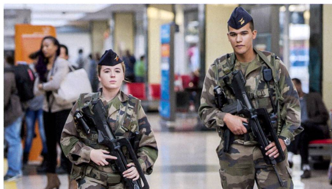
Depuis les attentats de 2015, l'opération SENTINELLE engage entre 7 et 12'000 militaires dans les lieux publics urbains à travers la France; certains personnels sont des réservistes.