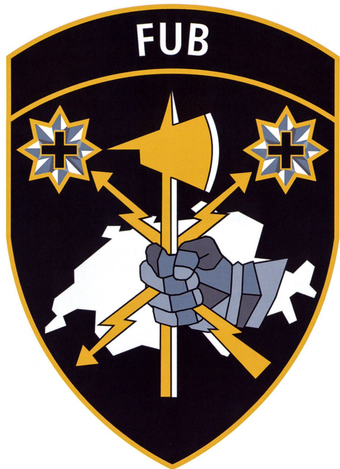
Insigne de la Base d'Aide au Commandement (BAC).

La formation en cybernétique se déroule sur une période de 40 semaines. L'incorporation ne s'effectue pas pour l'instant lors du recrutement mais après l'intégration dans l'armée. Les candidats doivent donc être aptes au