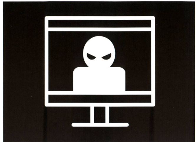
Formation cyber de l'armée suisse.

D'un point de vue personnel, le stage de formation offert par l'armée m'a permis de m'épanouir dans un cadre de prestige. J'ai pu renforcer mes connaissances dans le domaine, nouer des contacts qui me seront utiles dans ma vie professionnelle et observer de l'intérieur la façon dont s'organise la défense d'infrastructures aussi importantes que celles de l'armée. J'encourage fortement