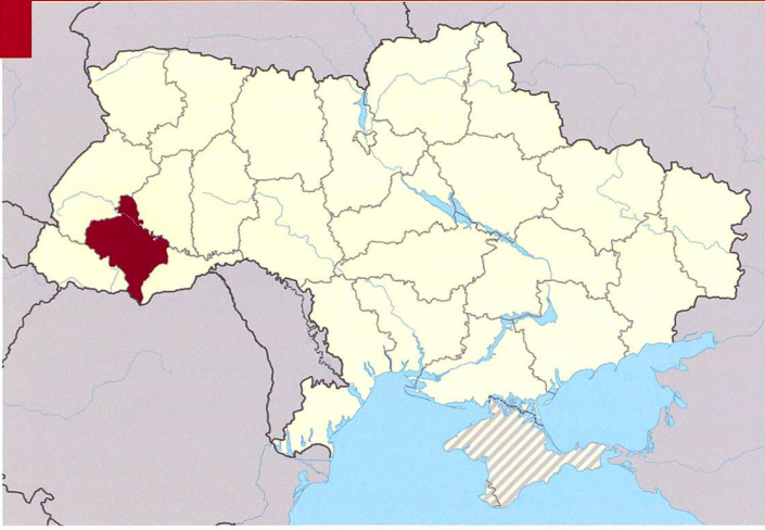
Oblast d'Ivano-Frankivsk, zone la plus touchée par les attaques de 2015.