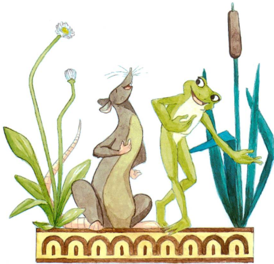
Les illustrations exclusives ont été réalisées spécialement pour cet ouvrage.