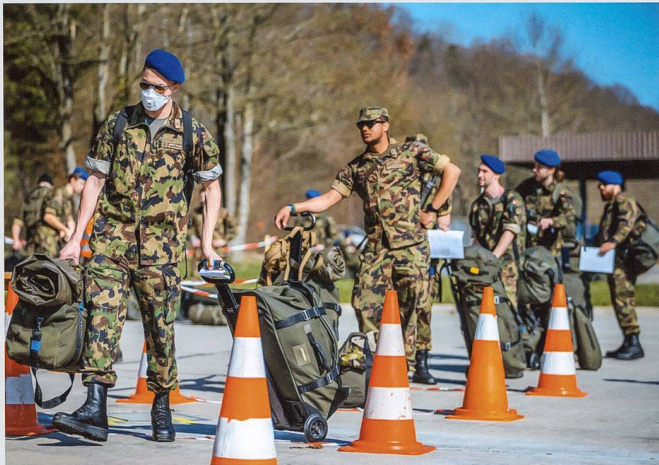
Engagement du bataillon hôpital 2 dans toute la Suisse romande.