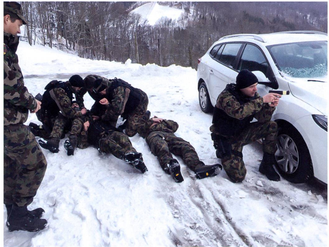
Ci-dessus : L'instruction se focalise sur les techniques et tactiques de police de sécurité.

Lundi 2 mars, secteur Wangen an der Aare. Les soldats des cp entrent en service, un peu déboussolés par les mesures décidées. Les accolades habituelles de retrouvaille font place à un certain inconfort. Tout le monde connaît la situation, tous ne l'ont pas encore pleinement appréhendé. À cette date, « seulement » onze cas sont confirmés en Suisse. Les cadres sont sur place pour garantir l'application des mesures de distanciation. Un soldat annonce avoir séjourné récemment en Lombardie. Il est immédiatement isolé ainsi que onze autres camarades avec lesquels il a eu du contact. Trois autres soldats sont envoyés au centre médical régional pour y effectuer un test de dépistage. Seul le test du soldat rentrant de Lombardie s'avéra positif.