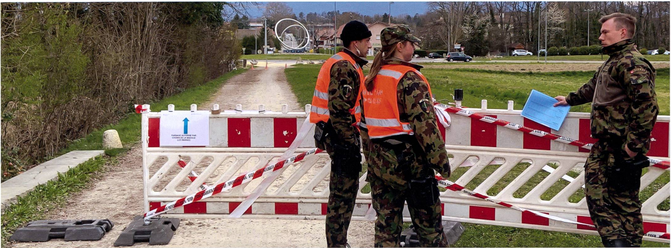
Les cadres ont la mission de contrôler le dispositif et maintenir la troupe opérationnelle.

certaine incompréhension, de l'énervernement et des doutes s'instaurent au sein des cp. Les différentes situations professionnelles et familiales des membres du bat n'aident pas à calmer les esprits et chacun est préoccupé. Les cadres du bat doivent tenir les troupes, les occuper, garantir leur disponibilité. L'EM bat est conscient que l'échelon opératif planifie et que la mission de sécurité se concrétise.