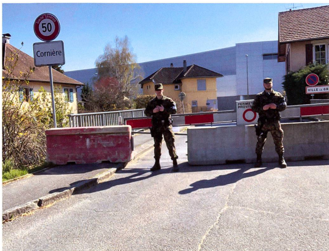
L'engagement commence le vendredi 27 mars 2020 et durera jusqu'au 7 avril 2020.

À l'échelon supérieur, le médecin de bat ira même jusqu'à prescrire au sein des unités une séparation jusqu'à l'échelon du groupe, afin d'empêcher que toute une unité ne voie sa capacité opérationnelle diminuée. Ses mesures, aussi drastiques qu'elles puissent paraître, permettent au bat de contenir la propagation du virus et aucun autre cas ne viendra perturber la suite du service.