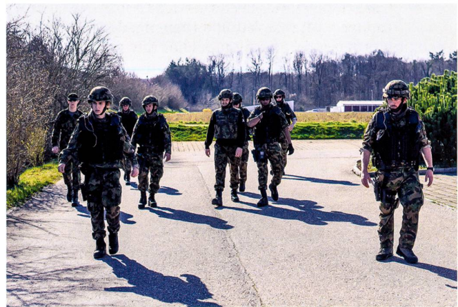
Ci-dessous : Les grenadiers et soldats de sûreté de la Police militaire sont formés au sein de l'École PM 19 à Sion.

L'Armée s'y attendait. Elle est le miroir de la population et les conditions de vie y sont particulières. On dort à l'étroit, sous terre, on mange et travaille ensemble dans des espaces parfois confinés. Tout en évitant de dramatiser la situation, le commandant de bat décide de placer les soldats exposés dans une infrastructure militaire sommaire sur la place de tir du Spittelberg. Un jeune lieutenant se porte volontaire pour conduire le détachement « quarantaine ». Ces soldats doivent aussi être instruits et la marche du service ainsi que l'instruction sont organisées de manière simple et efficace. Ce nouveau cantonnement est rustique, mais parfait pour cette phase, à bonne distance des localités environnantes et au milieu d'une place de tir. Le détachement passera dix jours sans contact physique avec le reste du bat, à l'exception des éventuelles visites du médecin de bat, en tenue de protection complète, pour effectuer un suivi de l'état de santé des hommes du détachement.