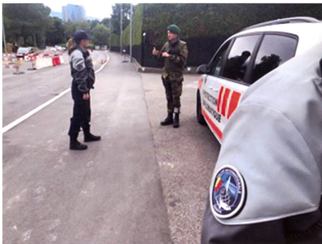
Contacts et échanges d'informations entre une patrouille d'ASP et les militaires en faction devant des missions nécessitant des mesures de sécurisation.

Le lundi 18 mai 2020, un premier désengagement partiel de l'armée sur le dispositif AMBA CENTRO a eu lieu et, depuis le 17 juin 2020, la police internationale a repris l'entièreté des missions AMBA CENTRO, avec la démobilisation complète de l'armée.