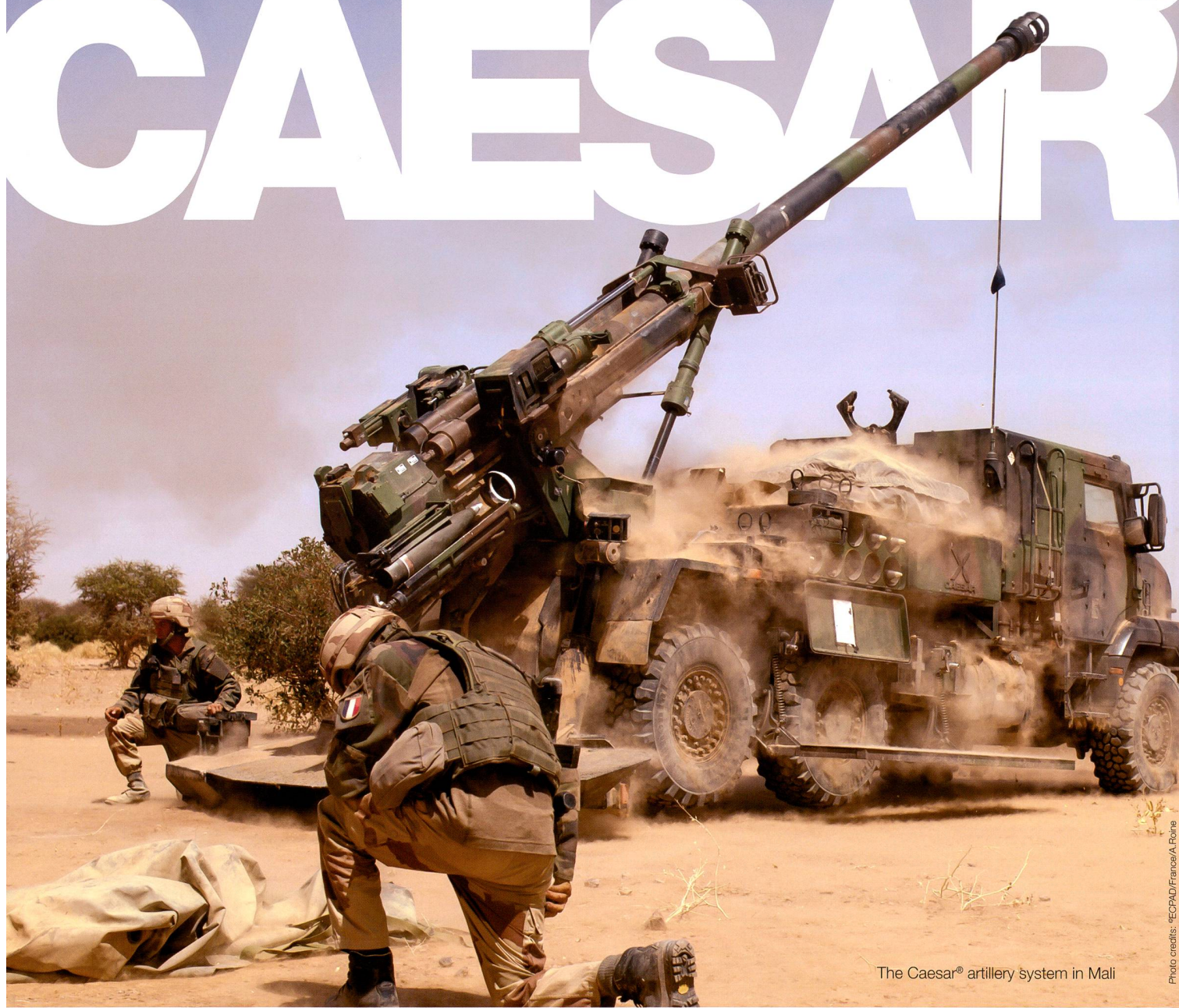
The Caesar® artillery system in Mali