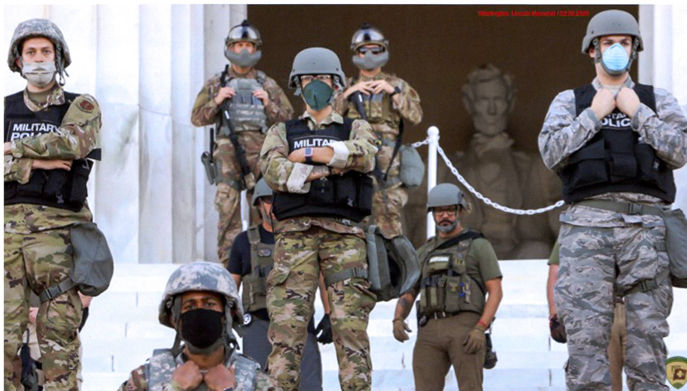
Déploiement des forces de l'ordre le 2 juin 2020 devant le Lincoln Mémorial à Washington.

A court et moyen terme (1-2 ans), tous les gouvernements, qu'ils soient autoritaires ou non, chercheront à assurer la sécurité de leurs populations, y compris par des mesures susceptibles de remettre en cause certaines libertés individuelles. Comme le succès actuel des produits proposés par les GAFAM (Google, Apple, Facebook, Amazon, Microsoft) le montre bien, un accroissement du rôle de l'Etat dans l'économie ne signifie pas la défaite des grands acteurs privés, en premier lieu ceux du numérique qui ont tiré profit du confinement et de la généralisation du télétravail, de la télémédecine ou de la télé-éducation. Il est probable que, comme à la suite des attentats du 11 septembre 2001, les populations acceptent dans leur majorité des atteintes significatives à leurs libertés. Et dans l'éventualité d'une résurgence du djihadisme, une sorte d'«état d'urgence permanent» pourrait même s'installer et s'inspirer du cas israélien.