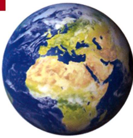
510,1 millions km 2