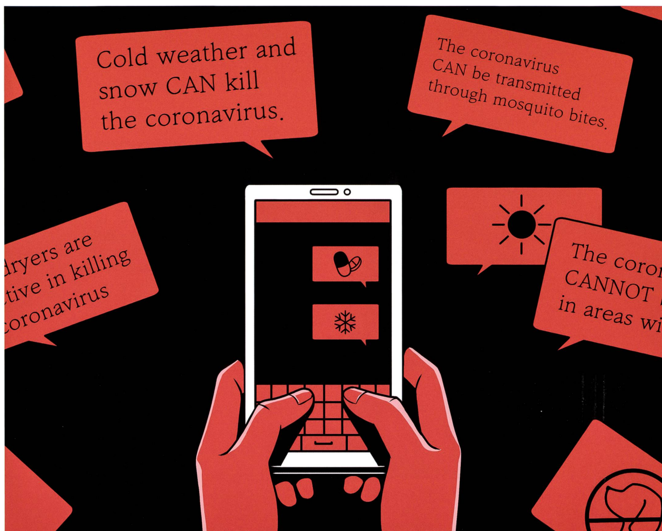
La dés/mal-information relatant à la pandémie fut rampante et compliqua l'évaluation des sources.

Malgré ces bienfaits, l'explosion et le trop-plein de données et d'informations est également un défi majeur pour l'OSINT. En effet, selon Travis Wright, aujourd'hui « les dirigeants et les organisations ne cherchent plus des aiguilles dans les meules de foin, ils cherchent des aiguilles spécifiques dans des montagnes d'autres aiguilles ». 9 En effet, la collecte de l'OSINT produit et brasse une grande quantité de données et d'informations qui doivent être fastidieusement triées, filtrées et analysées – à temps – pour être considérées comme utiles et pertinentes. Il existe de nombreux outils automatisés à cette fin, et de nombreux gouvernements et entreprises ont développé leur propre ensemble d'outils et de techniques d'intelligence artificielle pour filtrer les données collectées. Mais de telles informations ne peuvent souvent être vérifiées et questionnées qu'avec des outils de renseignement traditionnels et la « touche humaine ». En effet, il est souvent nécessaire de visualiser et comparer avec certaines données classifiées les résultats