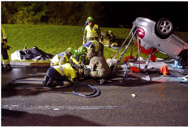
Exercice de sauvetage.

Payerne. Le scénario était une attaque d'un déséquilibré dans la zone de jeux des enfants. Quelques enfants de mon village venus prêter main-forte pour la simulation de cet exercice.