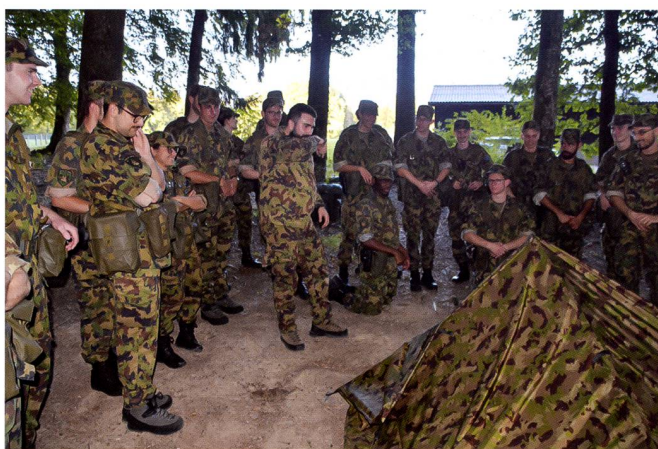
Marches, patrouilles, orientation, bivouacs et instruction au pistolet rythment les écoles d'officiers.