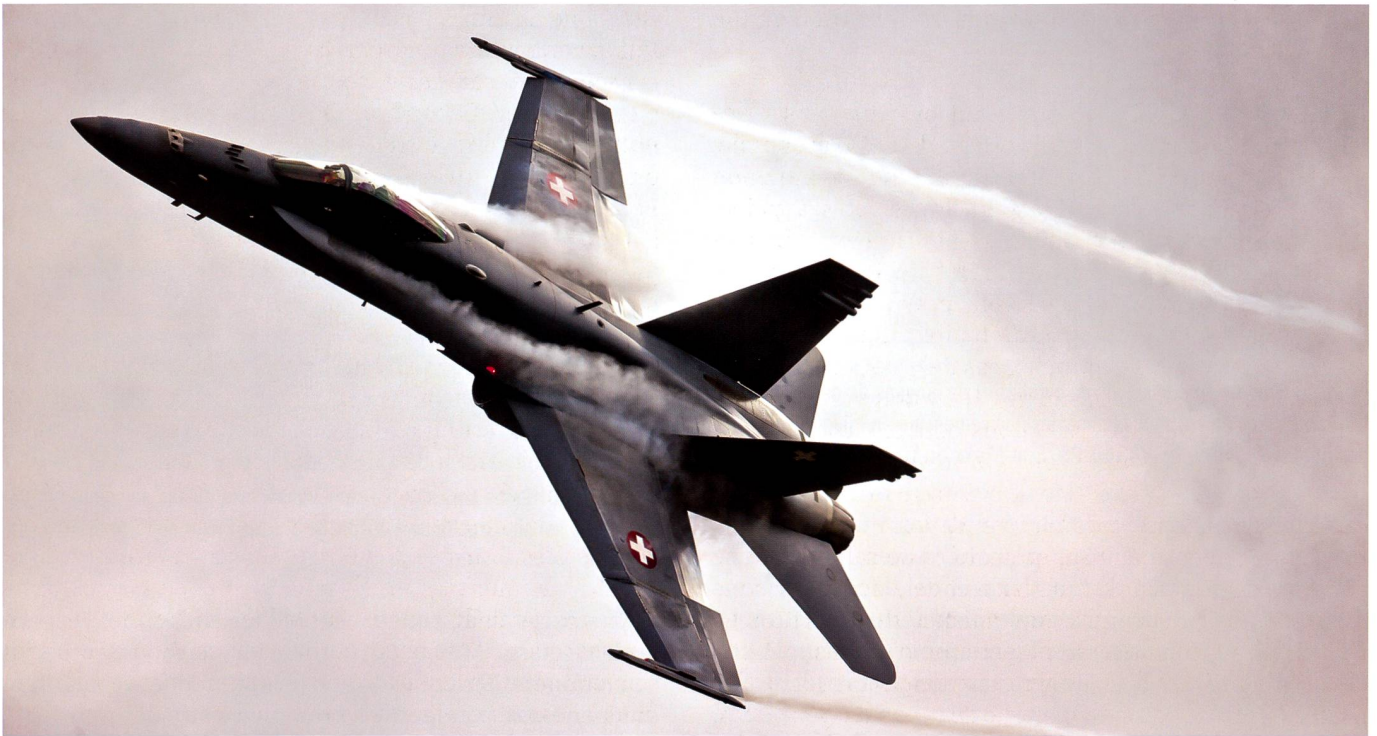
F/A-18 Hornet : les avions de combat sont un investissement à long terme pour la sécurité de la Suisse et de sa population.

Afin de protéger la Suisse rapidement, de manière efficace et effective contre les menaces aériennes en cas de crise, il n'existe actuellement aucune alternative appropriée aux avions de combat. L'utilisation exclusive de drones, d'hélicoptères de combat ou d'avions d'entraînement armés ne convient ni à la police aérienne ni à la défense aérienne. Ces aéronefs sont trop peu performants pour combattre avec succès un adversaire équipé de façon moderne : Les drones sont efficaces dans la reconnaissance aérienne ou pour effectuer des frappes sur des objectifs au sol mais ne conviennent ni à la police aérienne ni à la défense contre les avions de chasse ou les missiles de croisière. Bien que les hélicoptères de combat puissent appuyer les forces terrestres, ils sont trop lents pour la police aérienne ou la défense aérienne et ne peuvent pas voler suffisamment haut. Il n'y a pas non plus d'avions d'entraînement actuellement disponibles sur le marché qui répondraient déjà aux exigences minimales pour le service de police aérienne : selon le type, ils leur manquent la capacité de voler à des vitesses supersoniques, la capacité d'accélération ou ascensionnelle, des capteurs performants (par exemple un radar) ou un armement approprié. Les avions d'entraînement armés ne seraient en outre pas en mesure d'intercepter à temps les avions hostiles et encore moins de les combattre.