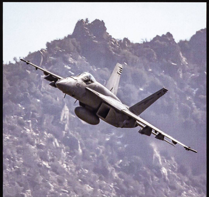
Les quatre appareils en lice pour maintenir la capacité d'intervention dans les airs de l'armée suisse au-delà de 2030 : l'Eurofighter Typhoon , le Boeing F/A-18 E/F, le F-35 Lightning II et le Dassault Rafale .