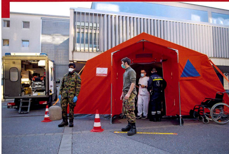
Engagement de l'armée, de la Protection civile et des services spécialisés à Neuchâtel, dans le cadre de l'engagement CORONA20.