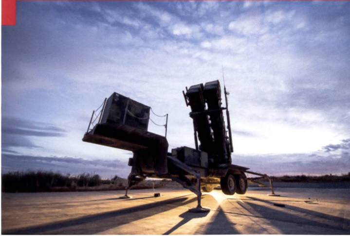
Le lanceur n'est qu'une composante d'un système complexe, fonctionnant en réseau.