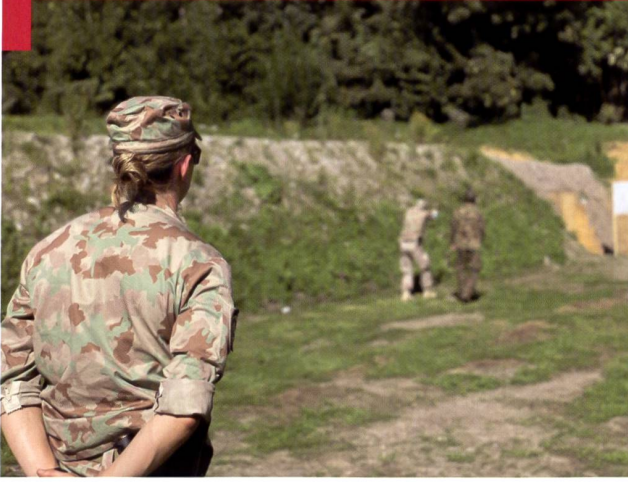
L'entraînement intensif pour la mission a lieu en Suisse.