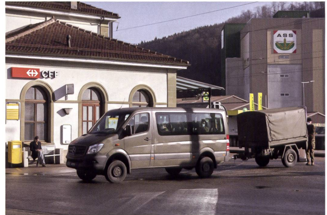
Entrée en service et relèves - la gestion du personnel a été un élément essentiel de la capacité des unités à l'engagement.