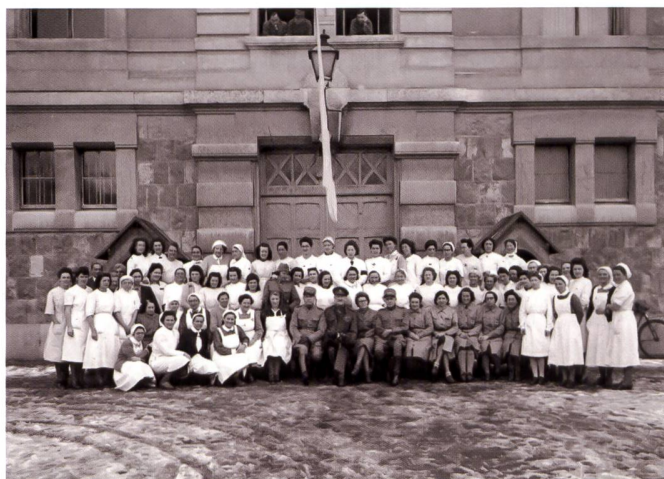
Mobilisation à la caserne de Genève d'infirmières Croix-Rouge et Officiers (1939-1945)