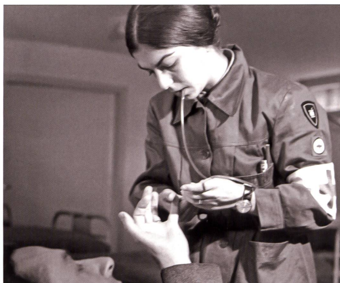
Ci-dessus : Laborantine SCR durant un CR(1975-1980)

Depuis ce jour nous sommes quelques 250 femmes justifiant d'une formation dans divers domaines de la santé, qui perpétuent de façon volontaire, une tradition, un héritage de toutes nos prédécesseurs qui avant nous se sont battues pour sauver des vies autant sur les champs de bataille de Solferino, durant les 2 guerres mondiales qui se sont succédées, que celles qui ont soigné durant l'épidémie de grippe espagnole.