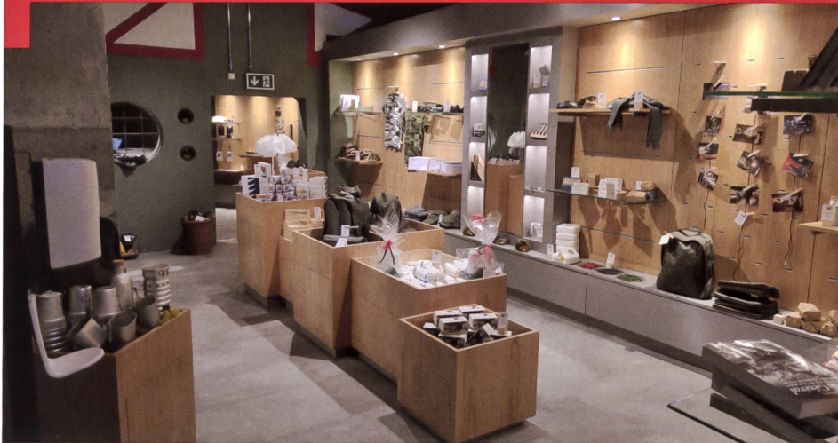
La boutique du Fort dans l'ancien magasin matériel.