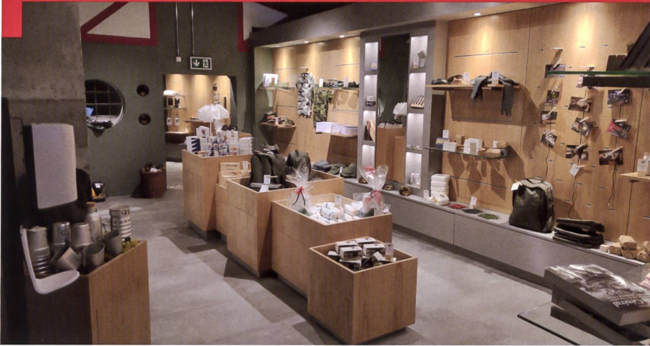
La boutique du Fort dans l'ancien magasin matériel.