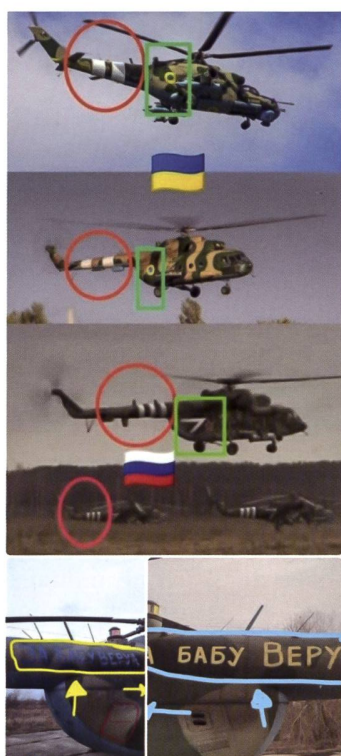
Marquages d'identification des hélicoptères russes et ukrainiens.

Quant à l'Inde, avec son milliard et demi d'habitants et qui ne dispose même pas d'un siège permanent au Conseil de sécurité alors que la France et la Grande-Bretagne en ont deux avec dix fois moins de citoyens, elle ne peut se résoudre à se laisser marginaliser par une victoire totale de l'Occident. Le non-alignement est une affaire d'honneur et de survie géopolitique pour elle.