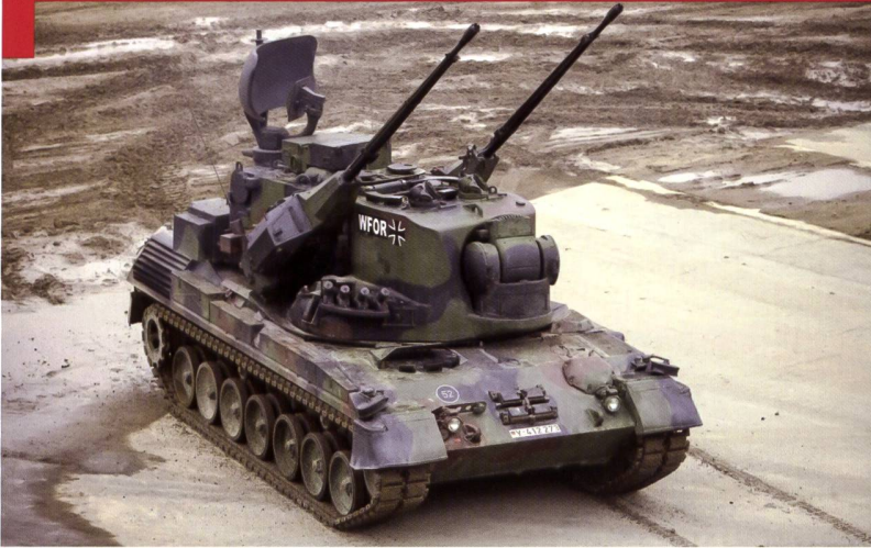
Le char de défense contre avions Gepard allemand, a également servi aux Pays-Bas et en Roumanie. L'armement consiste en deux canons de 35 mm Oerlikon (ci-dessous) fabriqués en Suisse.