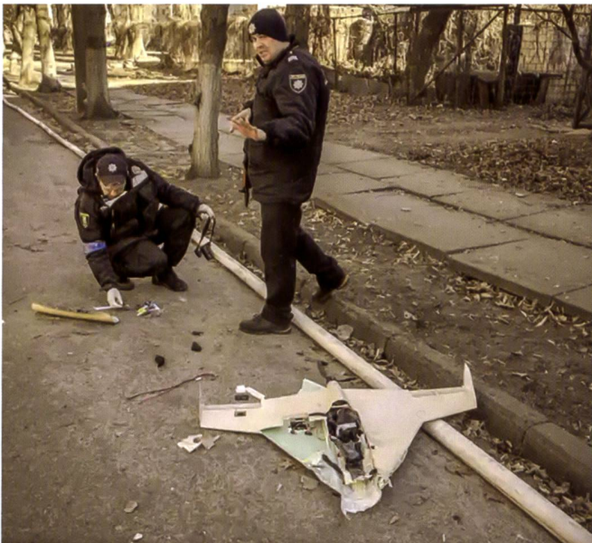
Drones russes engagés dans le combat de localité, récupérés par des policiers.