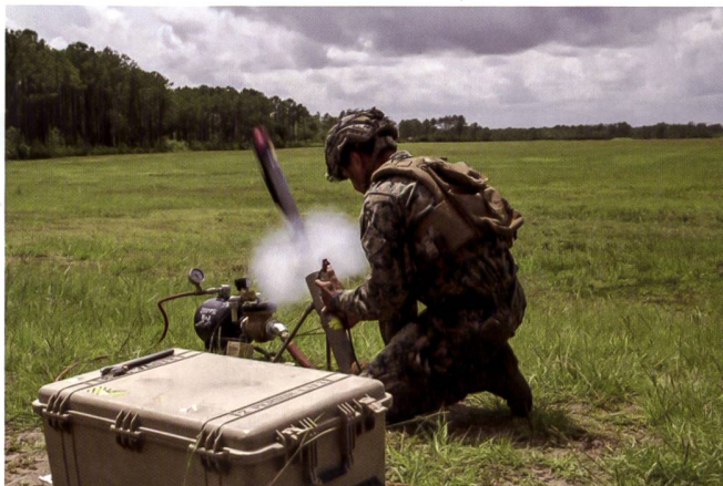
Lancement d'une munition-kamikaze américaine Switchblade 300 . Les premiers rapports font état d'une charge explosive trop faible sur ce modèle.