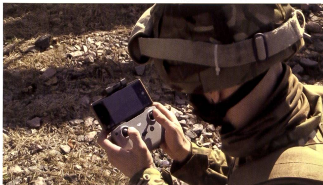
Certains drones sont engagés et pilotés par les unités de front.