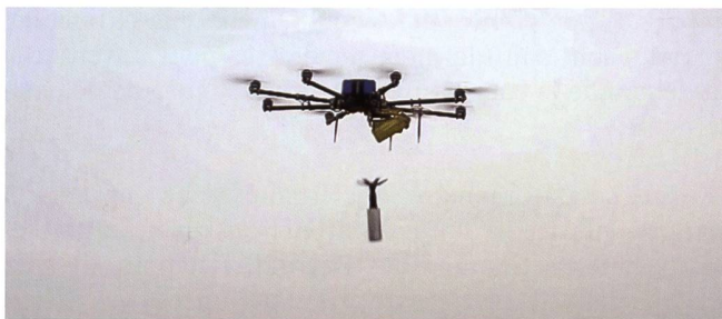
Un R18 Octocopter de la société ukrainienne Aerozvidka. Le système permet de viser et de lâcher une bombe non guidée armée d'une charge creuse.