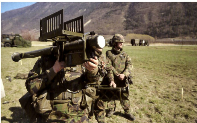
Le système engin guidé pèse environ 16 kg et permet de combattre un adversaire dans l'espace aérien inférieur.