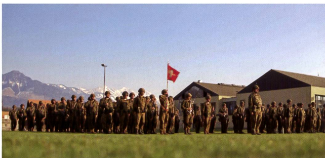
L'étendard du Gr eg L DCA 1 flotte fièrement dans le ciel gruérien, à deux pas de l'ancien aérodrome de guerre de la 2 e escadrille.

formation de disponibilité et nous devons nous tenir prêts à toute éventualité. Le jour de la prise de l'étendard, la barre des 2 millions de réfugiés ukrainiens venaient d'être franchie. Afin de mettre une réalité concrète sur ces chiffres, cela représente le déplacement de l'entier de la population de Suisse romande, en l'espace de seulement 2 semaines. Face à cette réalité, la troupe se rendit compte de la gravité de la situation et afficha d'entrée sa motivation à être engagée, quelque part en Suisse, au profit des autorités civiles, si cela avait été nécessaire. Peu à peu, durant le cours, il apparut que notre concours ne serait pas requis et la motivation initiale laissa place à des sentiments partagés entre la satisfaction de savoir que notre pays avait su faire face à un tel afflux de réfugiés et la motivation déçue de n'avoir pas été engagé pour apporter son aide. Même si le Groupe n'a pas été requis, un élément avait toutefois changé durant ce cours, à savoir le regard de la population. En effet, après quelques jours, certains cadres me firent remarquer que la population les saluait dans la rue. Et il est vrai que, par rapport à nos cours précédents, le changement était notable, car il semblait que la population nous regardait avec respect et voyait à nouveau une utilité dans le temps que nous consacrons au pays en uniforme. C'est en tous les cas ce qui a pu ressortir des différents échanges que nous avons eu avec la population civile.