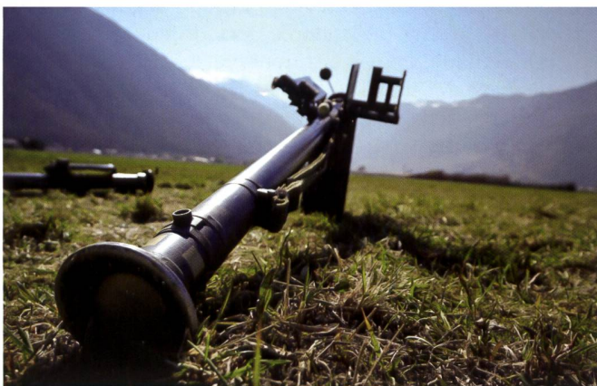
Dans le Soleil valaisan, un Stinger monte la garde.