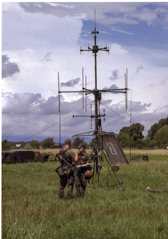
Antenne goniométrique de la GE, composant sensoriel de l'IFASS.

Les informations obtenues doivent alors être vérifiées par d'autres éléments du service de renseignement. En raison des propriétés physiques des ondes radio et de leur possibilité d'évaluation limitée, les conclusions de la GE sont certes rapides mais géographiquement peu précises. Par exemple, des phénomènes radio tels que les reflets à la surface d'un lac ou sur une crête ou leur atténuation par la forêt peuvent fausser le résultat. Les interprètes ont pour mission d'en tenir compte au mieux dans leur évaluation et d'informer les autres destinataires de leurs rapports à ce sujet.